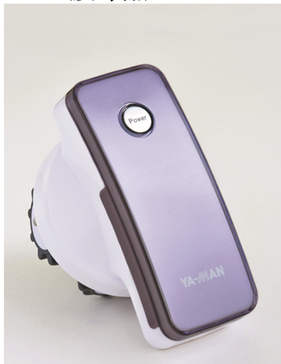
アセチノシリーズ (痩身器)