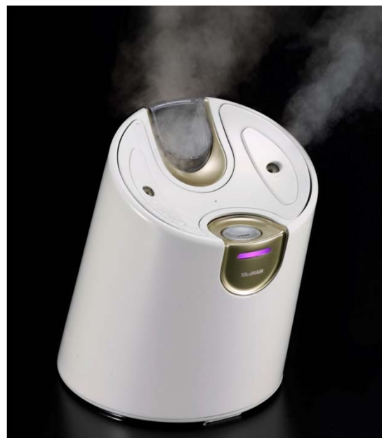
HCボーテシリーズ (温冷美容器)