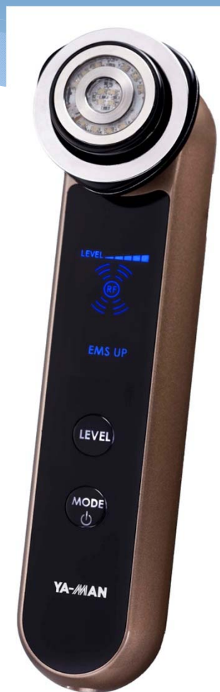
RFシリーズ (ラジオ波美容器)