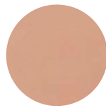
ミネラルソリッドコンシーラー 01 オークル 2g (限定品)

ミネラルパウダーが毛穴を埋め、淡いミントグリーンで赤みをカバー。ハイライトにも。 使用方法：適量を指にとり、小鼻や頬の内側にくるくるとなじませます。