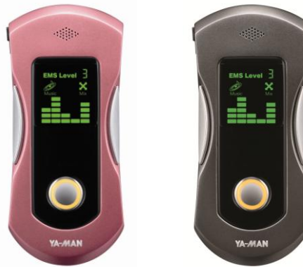
ダンシング EMS Bluetooth (ブラック・ピンク)