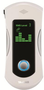
ダンシング EMS (ホワイト)