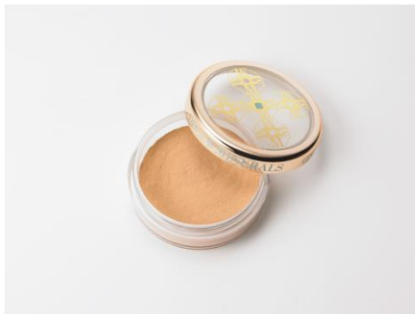
薬用ホワイトニングファンデーション(医薬部外品) 【2.5g単品】税込 3,348 円(3,100 円) 【7g単品】税込 4,212 円(税抜 3,900 円) ※単品は 2014 年 3 月より発売中

美白*1 美容液や日焼け止め、化粧下地、シミにはコンシーラー、そしてファンデーション…。美しい肌をキープするには、根気と手間、そして厚塗りに見せないテクニックが必要でした。そこでオンリーミネラルは、カバー力と素肌のような自然な仕上がりを両立し、さらにUVカット、美白*1 ケアまでをたった1品で叶えるファンデーションを開発。日焼け止め特有のキシキシ感がなく、パウダーなのにしっとりクリーミーな使用感。毛穴やシミ・色ムらのない透明感あふれる肌を演出します。またノンケミカル処方でクレンジング不要。つけている間、落とすときも肌への負担を気にせずに使え、敏感肌の方にもおすすめです。