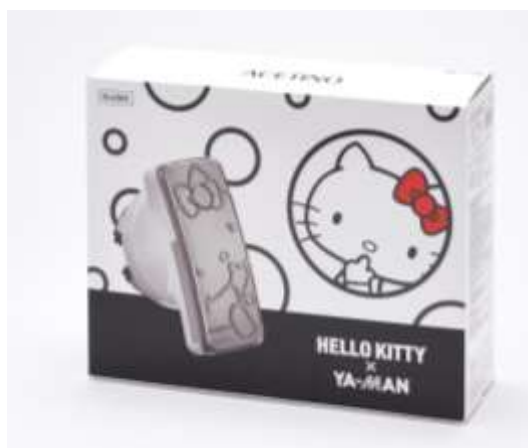
【パッケージイメージ 表】