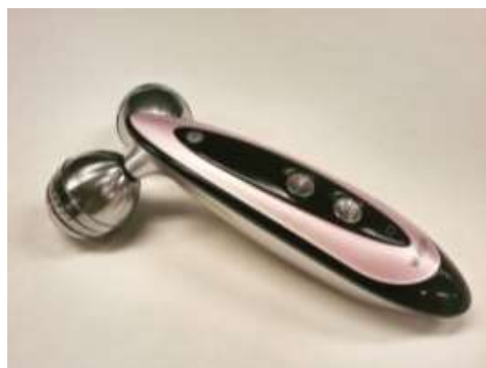
トルネード RF ローラー