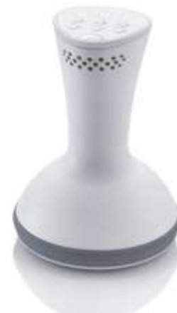
キャビスパ for Pro