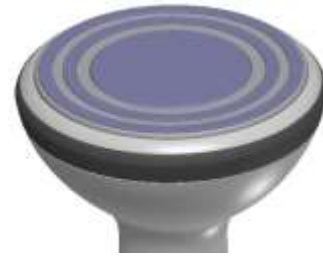
特殊円状フラット電極ヘッド