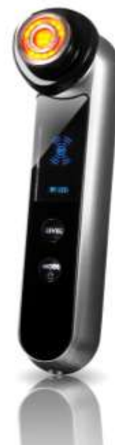
プラチナホワイト RF for Salon