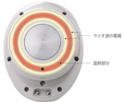
サークル RF テクノロジー